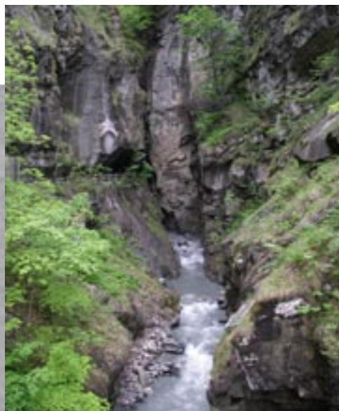
Spaziergang zur Quelle