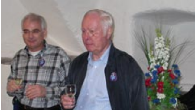
Apero im Bad Pfäfers