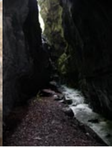
in der Schlucht