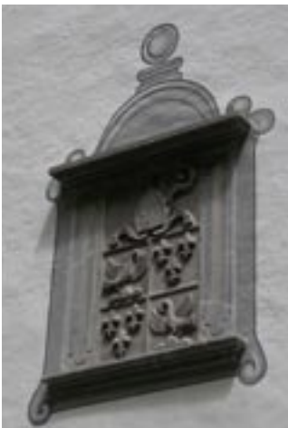
Wappen eines Abtes von Pfäfers