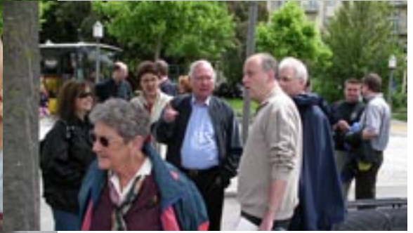
Man harrt der Dinge...