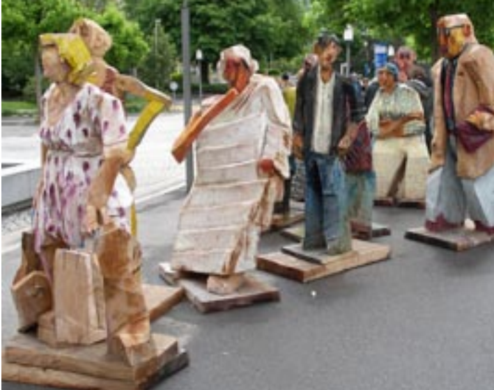
So hölzig sind wir dann doch nicht! (Figuren beim Bahnhof Bad Ragaz)