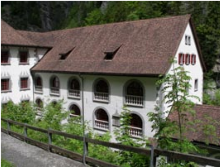
Altes Bad Pfäfers